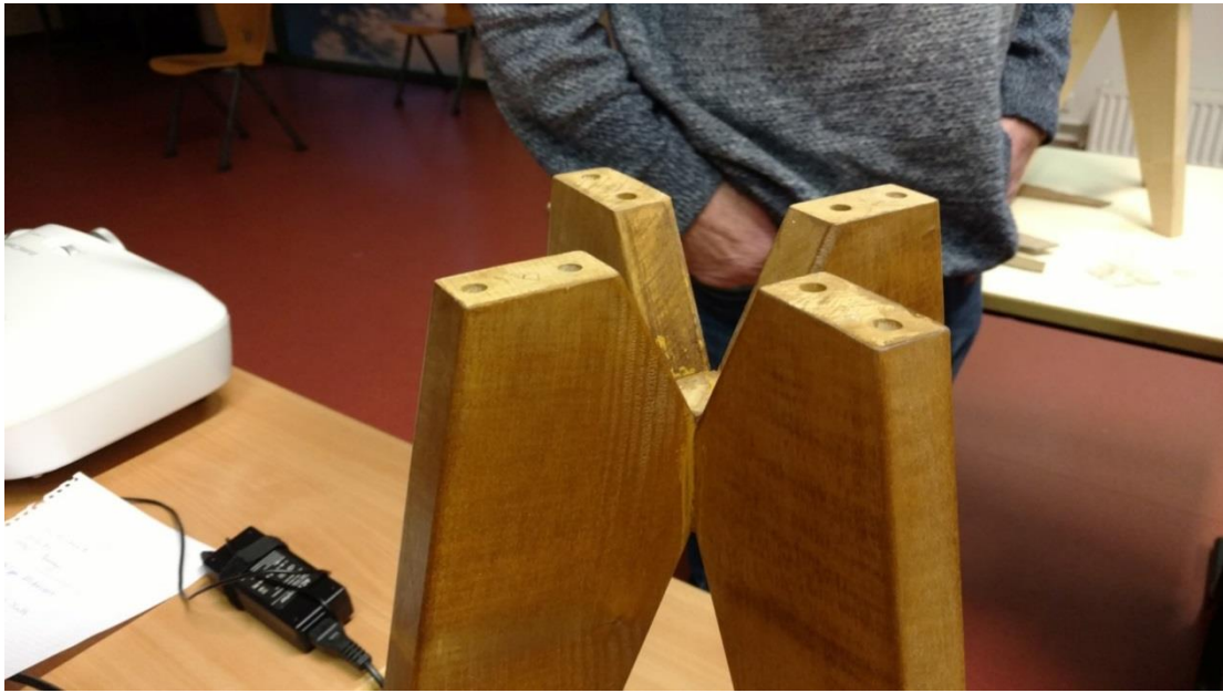
Canons de perçages Axminster diam ext 14mm